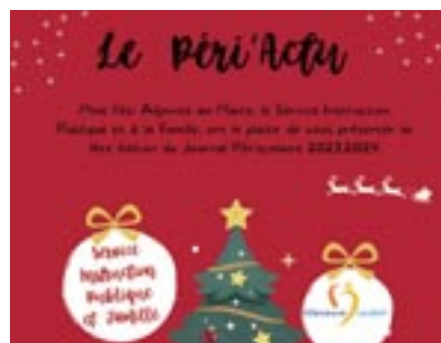
↑ Le journal des activités périscolaires Les familles reçoivent le journal des activités périscolaires suivies par les enfants dans chaque école (téléchargeable aussi sur le site de la mairie : www.villeneuveloubet.fr ).