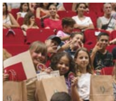
↑ Passeport du Civisme Les CM2 participent à des actions citoyennes à l'école et en famille. Coût : 2.500 €