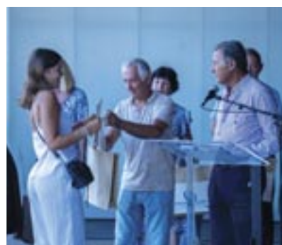
↑ Une jeunesse méritante Bacheliers (avec ou sans mention) et collégiens sont récompensés. Coût : 3.250 €