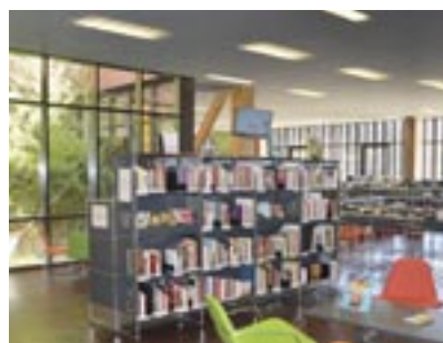
↑ La médiathèque pour les scolaires En accord avec la CASA, 2 matinées à la Médiathèque Jean d'Ormesson sont réservées aux enfants : visites découvertes, expositions, accueils thématiques y sont organisés.