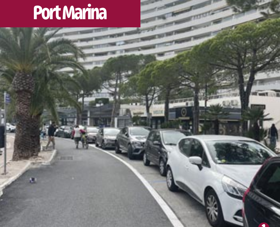
1 Rénovation de la Croisette André Minangoy. Coût : 1.600.000 € (dont 390.000 € reprise des éclairages - installation de bornes festives pour la commune)