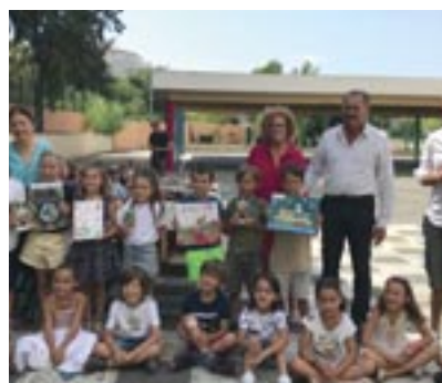
↑ Programme Watty : Sensibilisation des élèves aux économies d'eau et d'énergie. Coût : 15.000 €