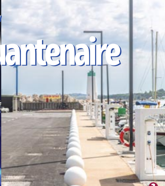
3 Rénovation complète de la digue Nord comprenant un parking de 113 places. (Coût 1.700.000 €)

Dans le cadre de la nouvelle concession portuaire attribuée à la SAS Maribay (groupe Eiffage, Sodeports et Caisse des Dépôts et Consignations), les travaux se poursuivent avec une rénovation complète d'un complexe qui a plus de 50 ans. À commencer par les importantes améliorations apportées sur la Croisette Minangoy (1) où tous les réseaux (eau, électricité et mise en place de la fibre optique...) sont refaits et enfouis. Le changement de candélabres et le passage au LED s'effectue sur l'intégralité de l'éclairage public. Tous les pontons et les quais sont équipés de nouvelles bornes électriques sécurisées pour les plaisanciers comme on peut le voir notamment sur la digue nord entièrement rénovée.