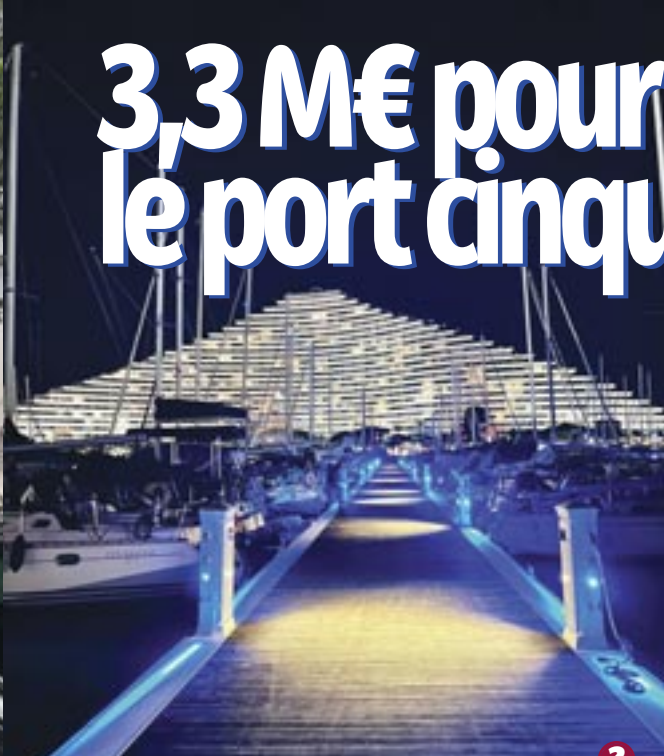
2 Réfection et passage au LED de l'éclairage public avec le remplacement de bornes électriques sécurisées.