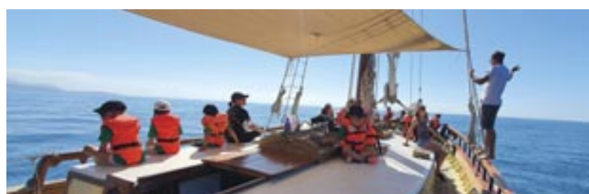
↑ Les sorties en mer de SOS Grand Bleu 8 classes découvrent le sanctuaire Pelagos avec des skippers et animateurs diplômés à bord du Santo Sospir, un bateau-école à voiles. Coût : 3.360 €