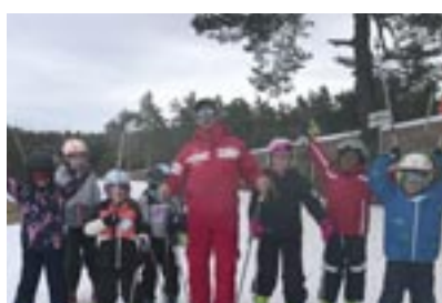
↑ Le Plan Ski du Département Sport et découverte de l'arrière-pays Coût : 5.700 €