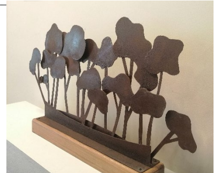
Jérôme Maligne, Arbres

en famille et en vacances à la découverte de l'exposition. Gratuit sur réservation*.