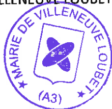
Lionnel LUCA Maire de Villeneuve Loubet

FAIT À VILLENEUVE LOUBET LE 21 SEPTEMBRE 2022