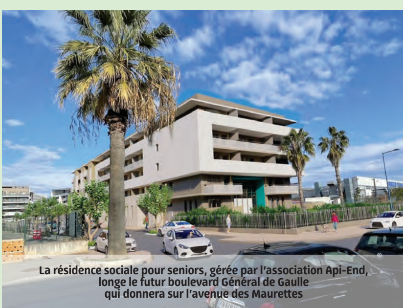
La résidence sociale pour seniors, gérée par l'association Api-End, longe le futur boulevard Général de Gaulle qui donnera sur l'avenue des Maurettes