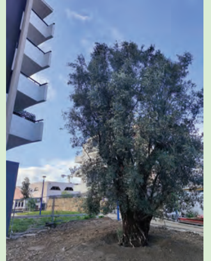
L'olivier plusieurs fois centenaire, offert par l'entreprise villeneuvoise Paysages Méditerranéens, a été planté au cœur du... Cœur des Maurettes