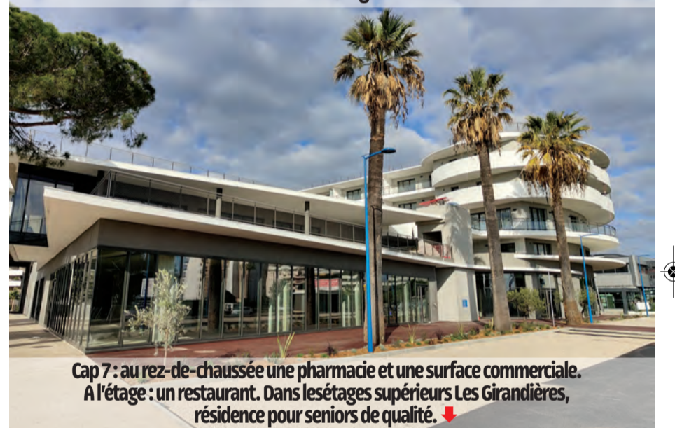
Cap 7 : au rez-de-chaussée une pharmacie et une surface commerciale. A l'étage : un restaurant. Dans les étages supérieurs Les Girandières, résidence pour seniors de qualité. ↓