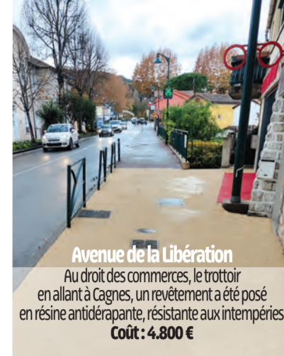
Avenue de la Libération

Au droit des commerces, le trottoir en allant à Cagnes, un revêtement a été posé en résine antidérapante, résistante aux intempéries. Coût : 4.800 €