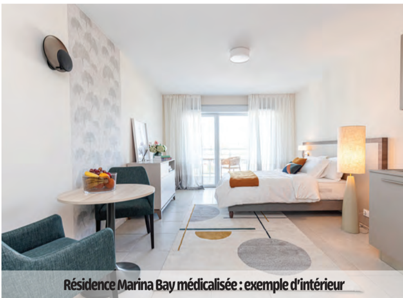
Résidence Marina Bay médicalisée : exemple d'intérieur