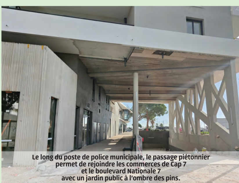
Le long du poste de police municipale, le passage piétonnier permet de rejoindre les commerces de Cap 7 et le boulevard Nationale 7 avec un jardin public à l'ombre des pins.

La volonté de la municipalité est de ne pas distinguer le logement privé du logement dit "social" et de proposer du logement pour tous de qualité avec une mixité générationnelle qui favorise la vie collective.