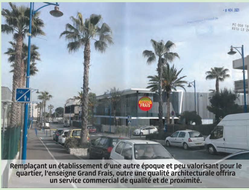
Remplaçant un établissement d'une autre époque et peu valorisant pour le quartier, l'enseigne Grand Frais, outre une qualité architecturale offrira un service commercial de qualité et de proximité.