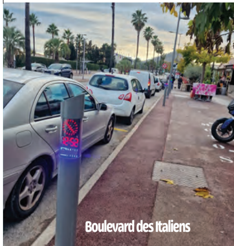
Boulevard des Italiens