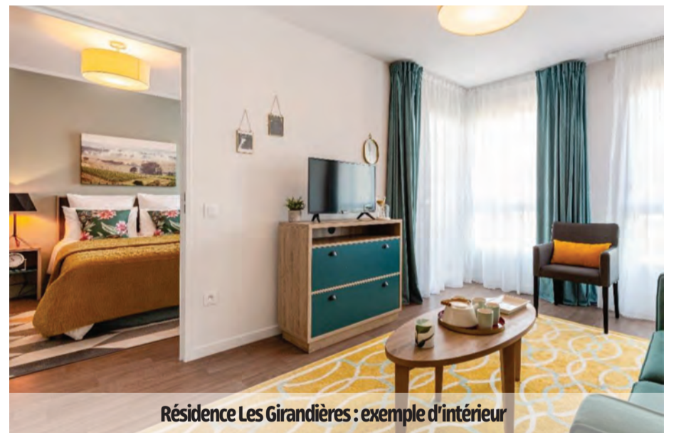
Résidence Les Girandières : exemple d'intérieur