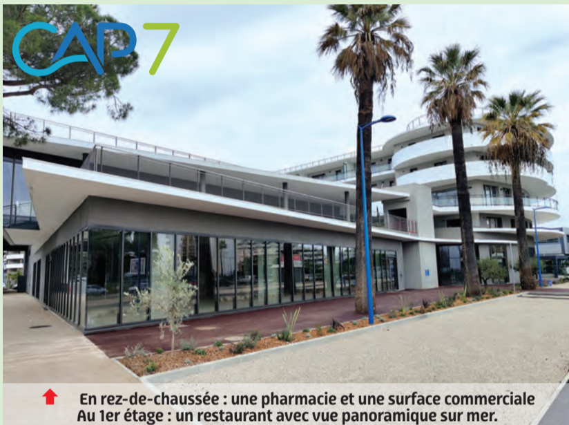
↑ En rez-de-chaussée : une pharmacie et une surface commerciale Au 1er étage : un restaurant avec vue panoramique sur mer.

Non contente de préserver les rares arbres présents (2 pins, 3 palmiers), la municipalité a davantage végétalisé l'ensemble par des arbres en pleine terre, notamment de nombreux magnolias - l'emblème choisi pour le Cœur des Maurettes -, sur le Bld Général de Gaulle et le passage Roger Roche. Par ailleurs, 2 jardins publics avec des espaces de jeux pour enfants ont trouvé leur place et des cheminements pour piétons et vélos ont été créés.