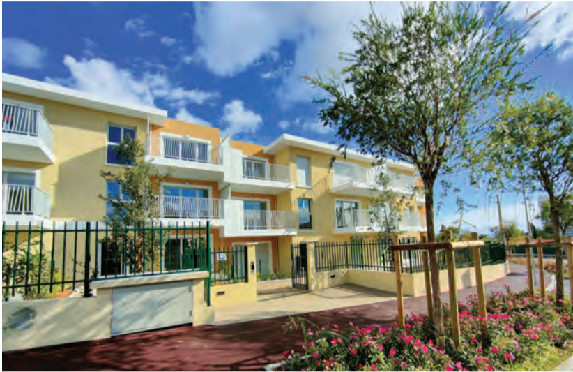
Résidence Villa Azur, avenue des Baumettes, a permis la réalisation d'un trottoir sécurisé et planté d'arbres ainsi qu'une résidence médicalisée, Marina Bay senior. ↓

Près de 500 Villeneuvois sont toujours dans l'attente d'un logement qu'ils ne trouvent pas dans le privé, sans compter les Villeneuvois, contraints de se loger ailleurs et qui souhaitent revenir. Le logement dit "social" est, aujourd'hui, du logement pour tous : depuis le jeune auquel on refuse la caution des familles dans le privé jusqu'au senior qui a perdu son conjoint et ne peut plus vivre dans le bien conjugal, en passant par le couple qui se sépare et pour lequel il faut absolument un logement pour accueillir les enfants. Critiquer le béton, c'est souvent un prétexte et toujours un réflexe de privilégié... qui n'hésitera pas, lui même, le moment venu, à solliciter un logement pour un membre de sa famille !