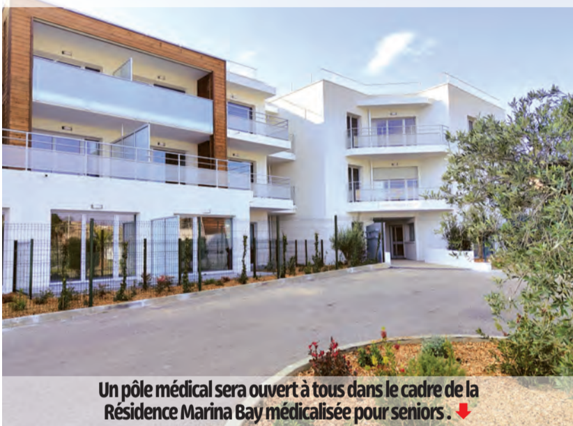
Un pôle médical sera ouvert à tous dans le cadre de la Résidence Marina Bay médicalisée pour seniors. ↓