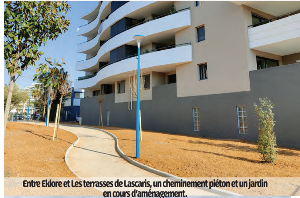
Entre Eklore et Les terrasses de Lascaris, un cheminement piéton et un jardin en cours d'aménagement.