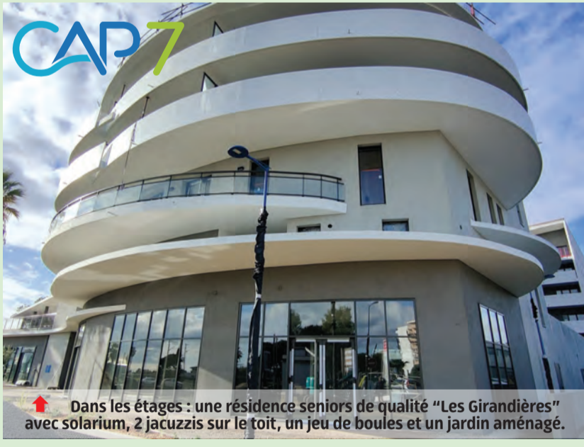
↑ Dans les étages : une résidence seniors de qualité "Les Girandières" avec solarium, 2 jacuzzis sur le toit, un jeu de boules et un jardin aménagé.