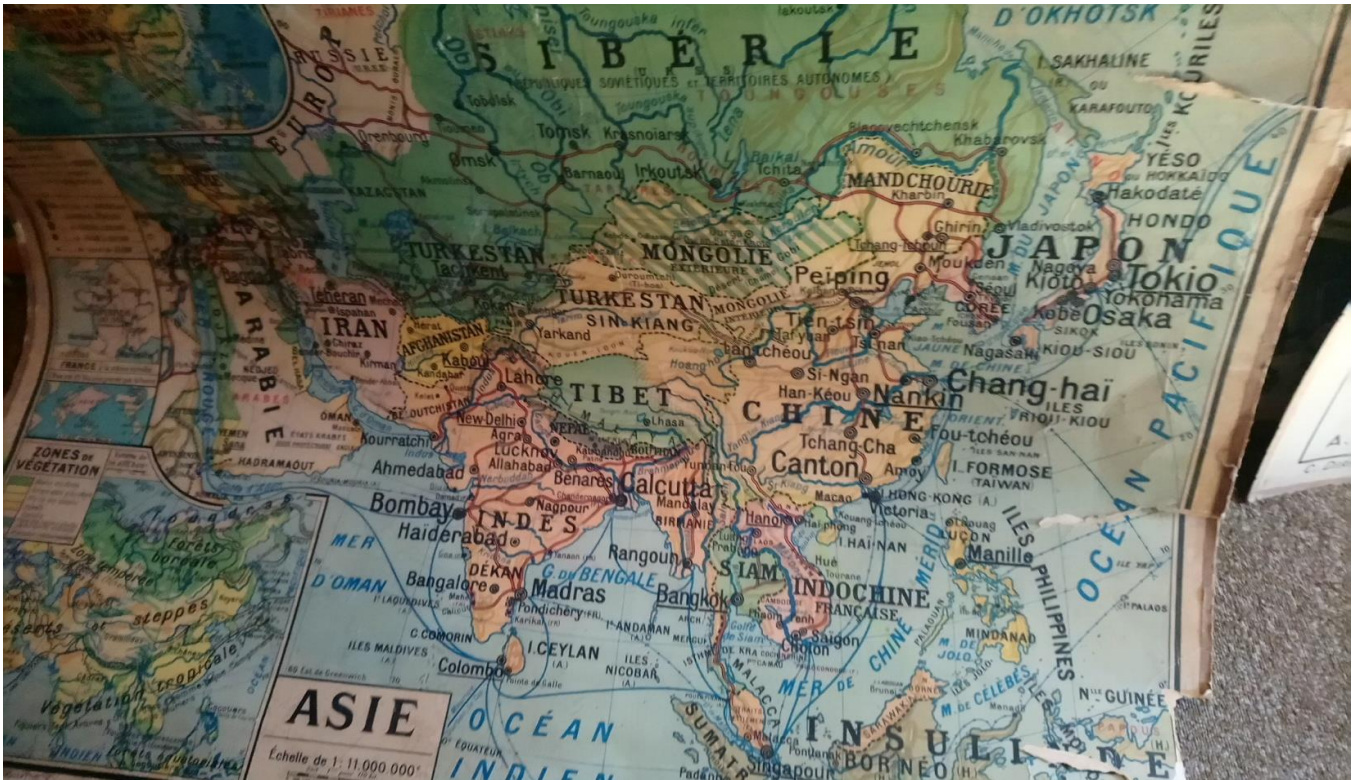
Carte scolaire datant de 1903